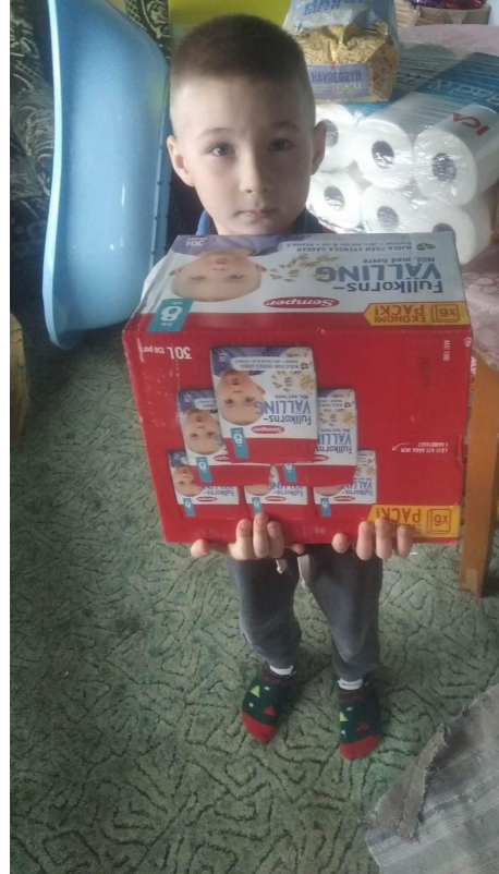
Bilder från tidigare hjälpsändningar till Ukarina från Alunda.