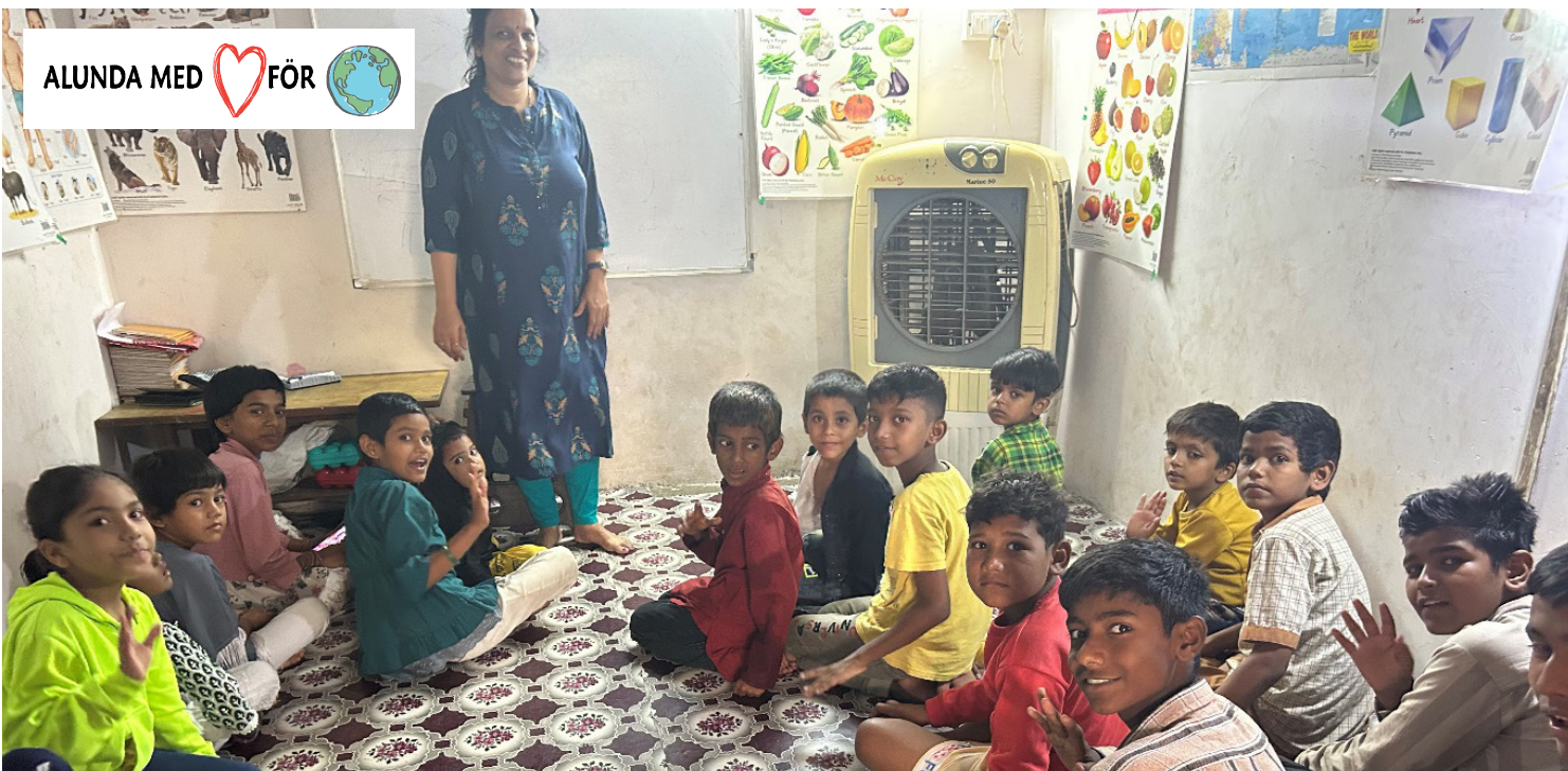
De här är barnen arbetar på sopberget, och efter varje arbetspass erbjud undervisning för att lära sig skriva och läsa.