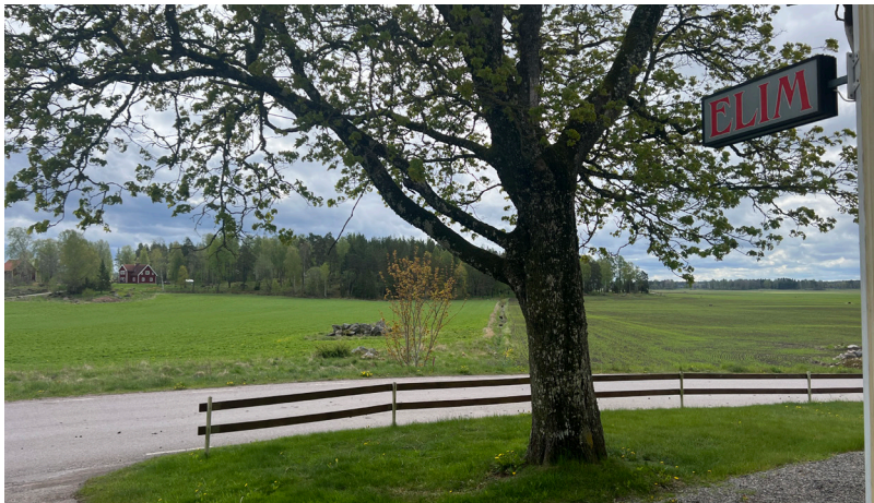
I Elim i Ekeby samlades vi till gudstjänst på Kristi himmelfärd dag. Utsikt från entrén till kapellet.