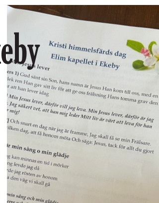
Sångprogram med texter för dagens allsång.

Och det är ju detta Kristi himmelfärdsdag handlar om, inte att Jesus försvann utan att han enligt Bibeln sitter på Guds högra sida, fullt ut levande. ”Jesus är vägen, sanningen och livet” som det står i Johannesevangeliet kapitel 14 och vers 6 i Nya Testamentet. Finns det liv finns det hopp. Och varje år, i vårt land ser vi det med våra egna ögon: ur den frusna och svarta jorden kommer det gröna strån, färgglada blommor och luften blir full av kvittrande fåglar. Hoppet lever!