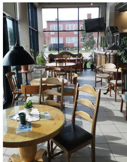
Du kan både fika och fynda på Öppen hand.